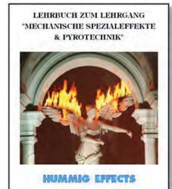
496 Seiten / 258 Abbildungen ISBN 978-3-931360-46-7