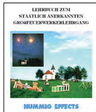
520 Seiten / 280 Abbildungen ISBN 978-3-931360-32-0