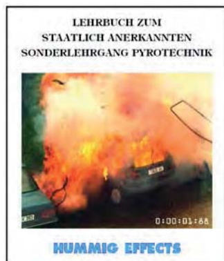
608 Seiten / 335 Abbildungen ISBN 978-3-931360-22-1